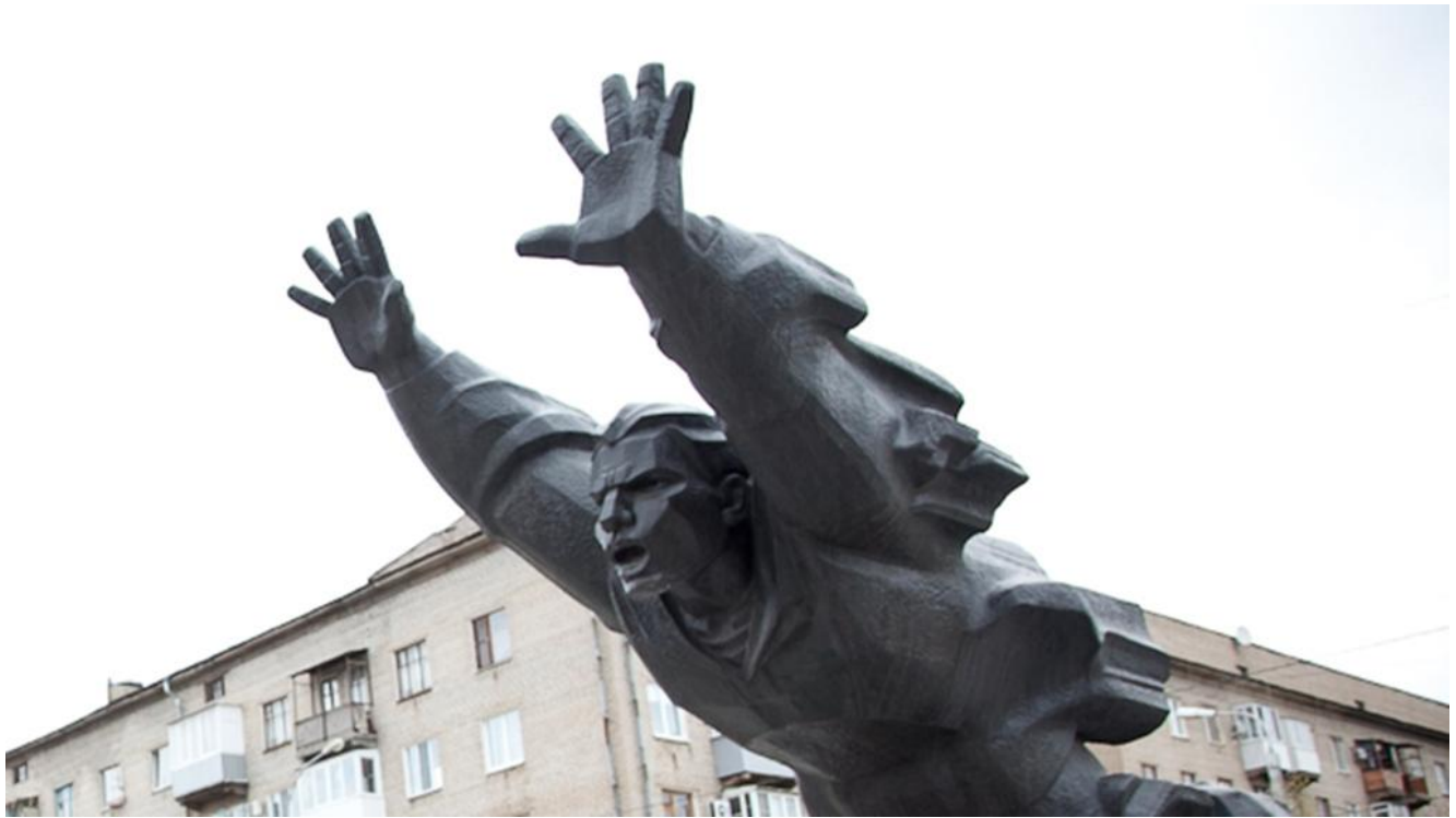
Памятник Михаилу Паникахе