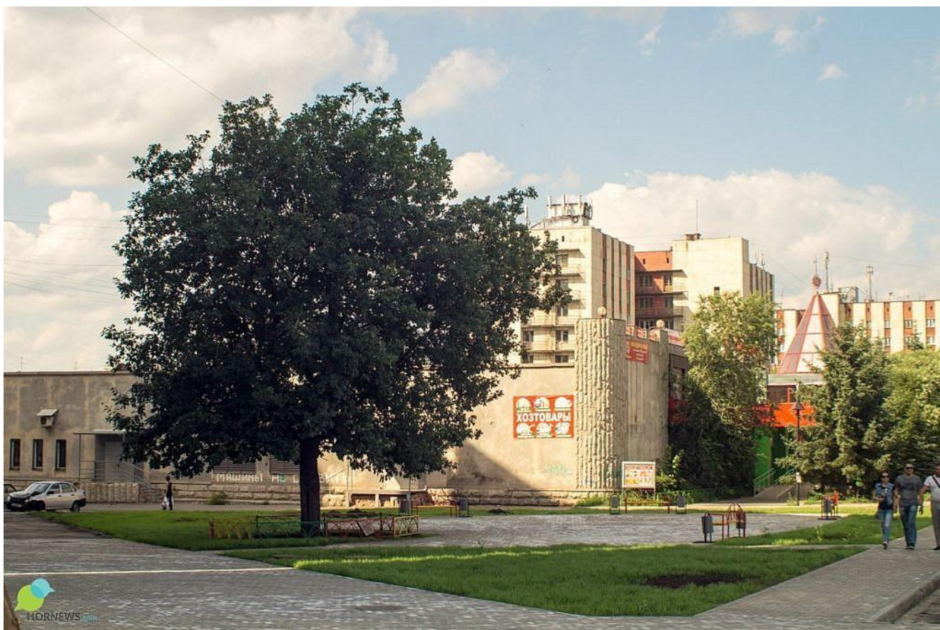
Дуб-памятник в Челябинске