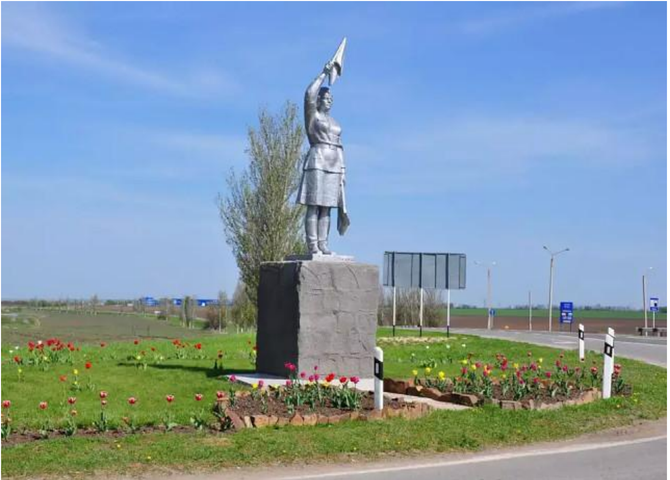
Маруся - регулировщица