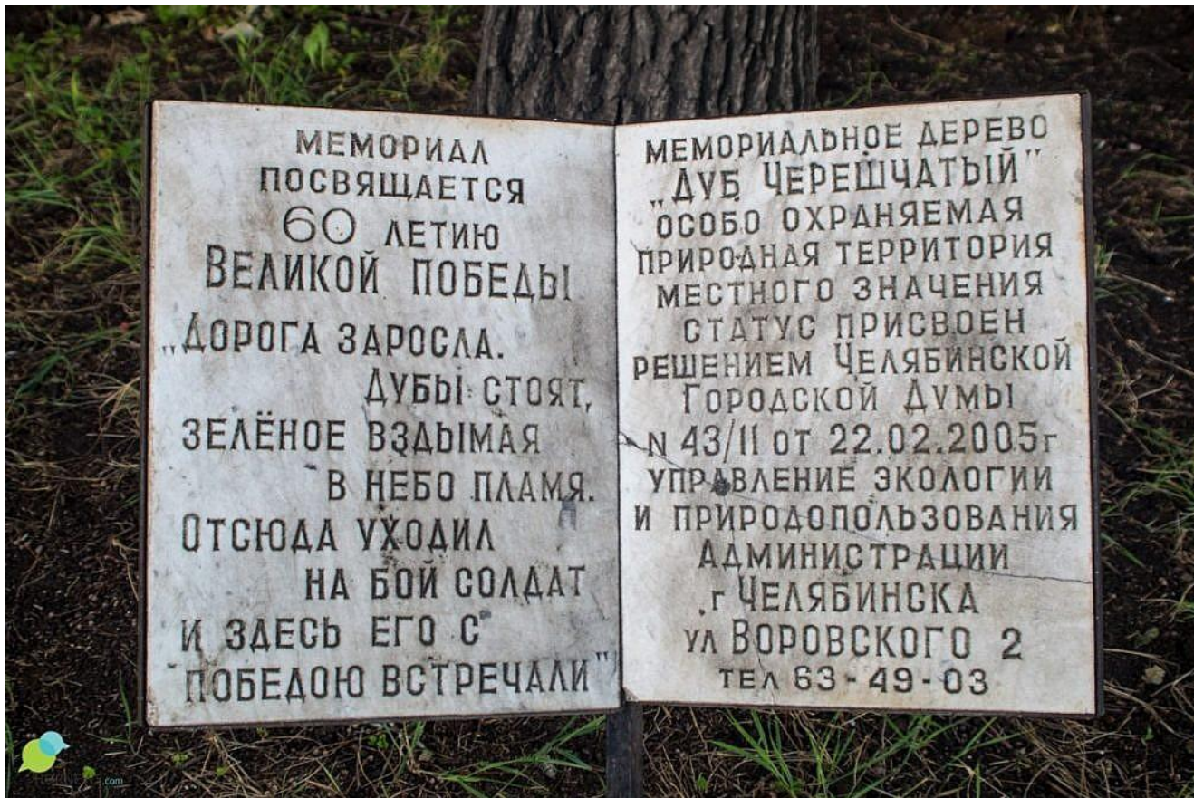
Дуб-памятник в Челябинске