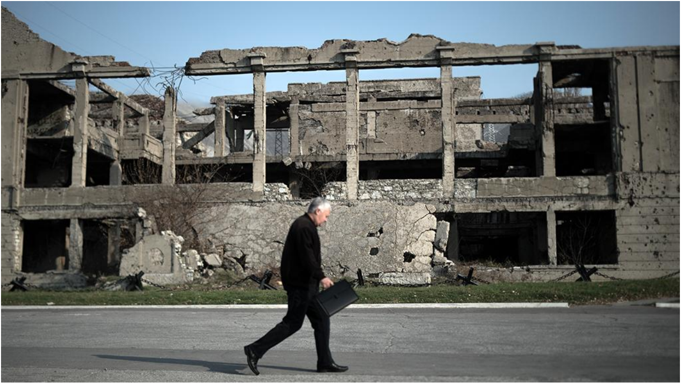
Дворец культуры цементников в Новороссийске