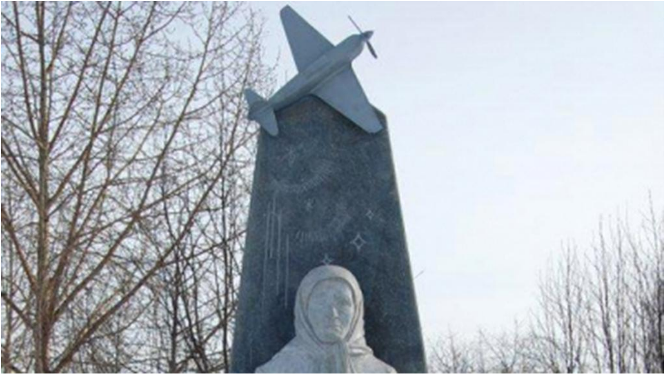
Памятник Матрене Яковлевой