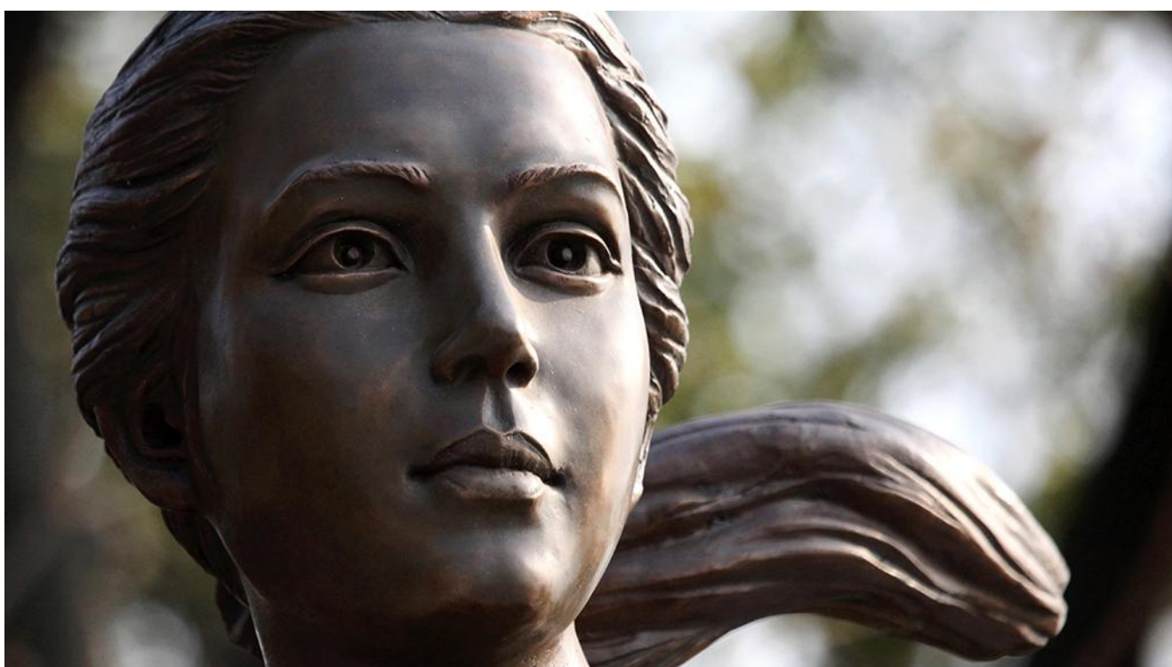
Памятник героине песни «Катюша»