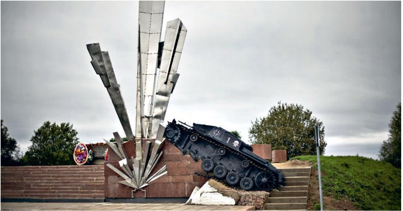
«Взрыв», Волоколамское шоссе