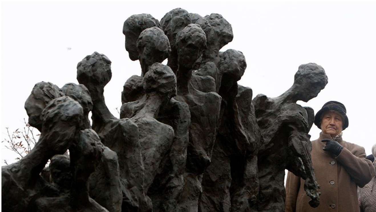
Мемориальный комплекс «Яма»

мемориала выполнялись вручную, без применения какой-либо техники.