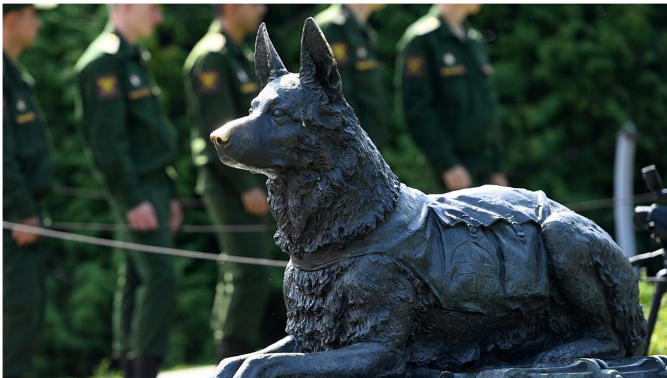
Памятник фронтовой собаке

и в Параде Победы на Красной площади летом 1945 года. Неудивительно, что заслуги четвероногих друзей также были увековечены в памятниках по всему бывшему СССР, самым известным из которых является московский памятник, который часто называют просто «Друг».