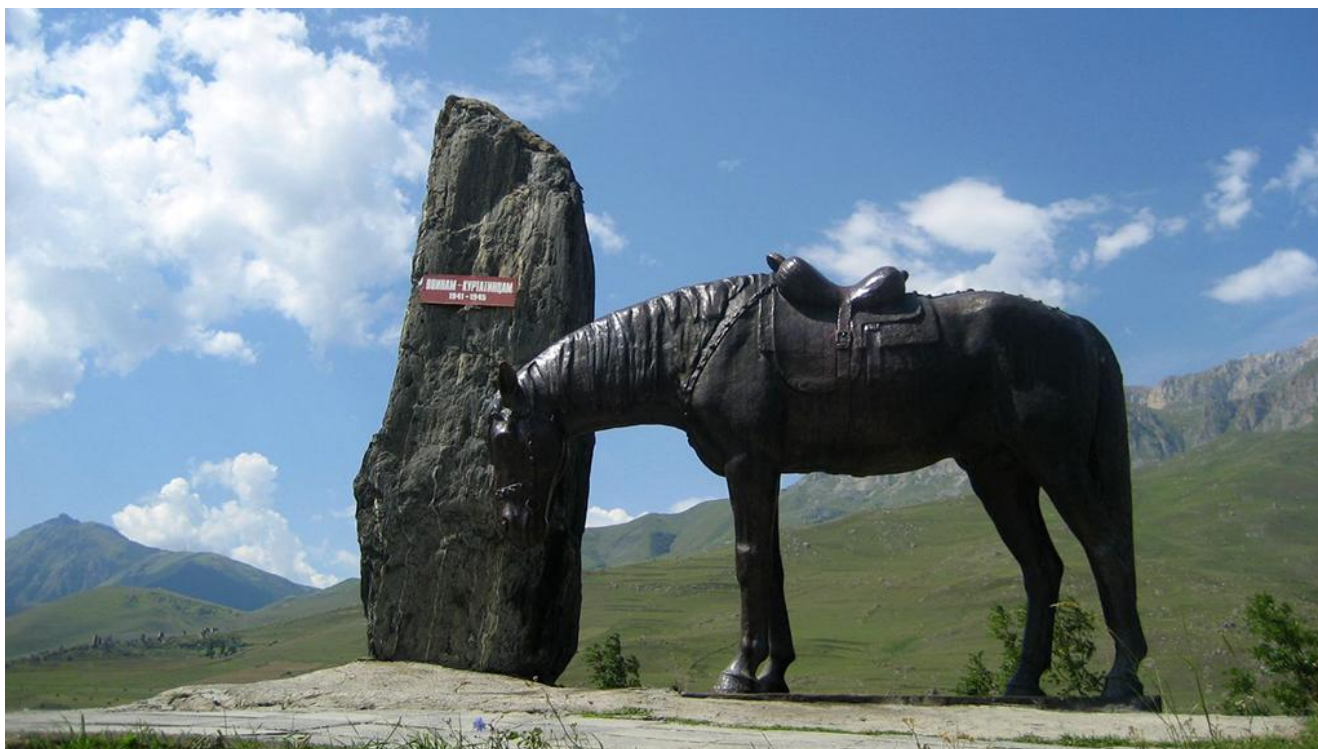
Памятник погибшим воинам-куртатинцам