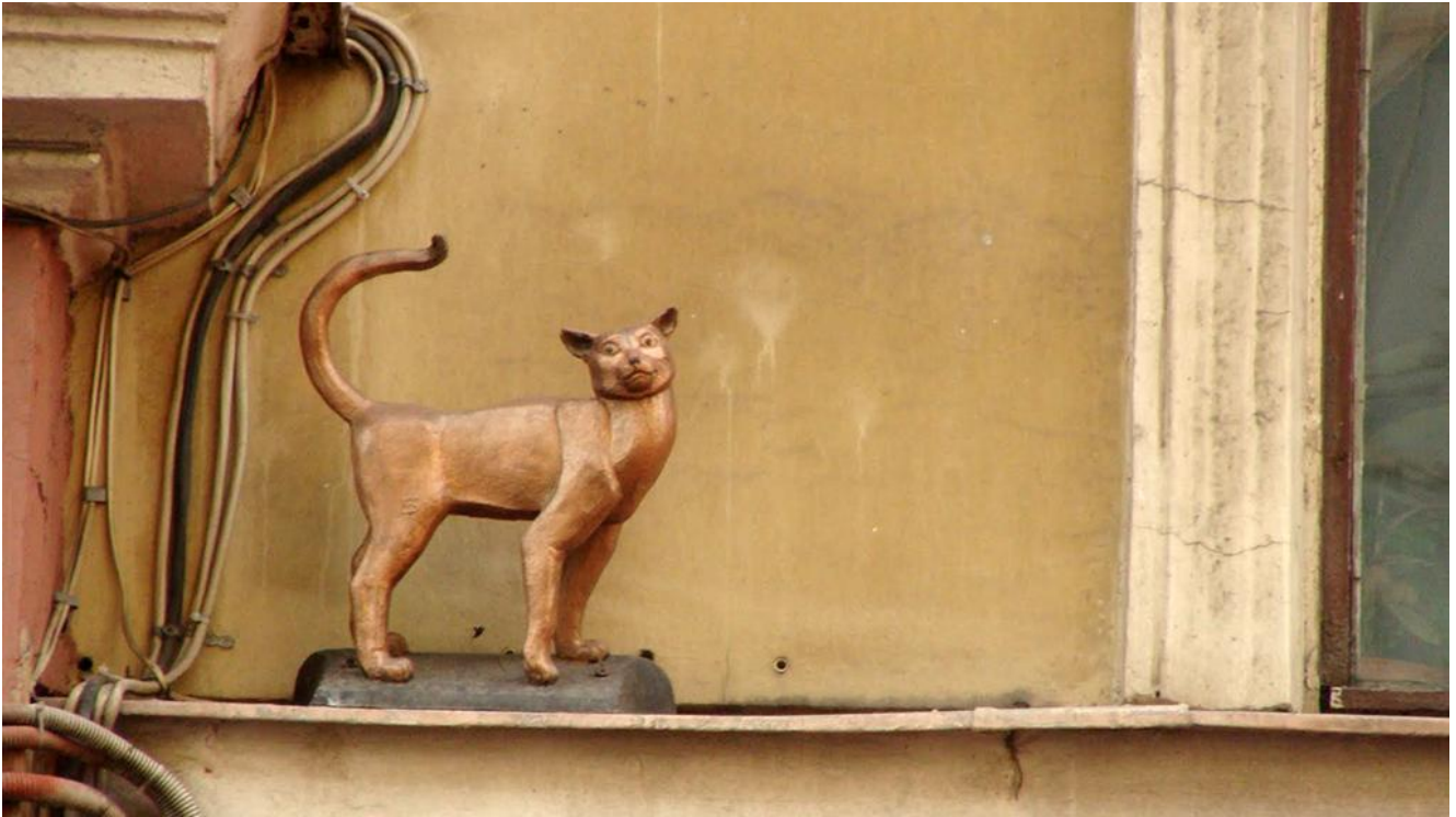
Памятники блокадным котам Ленинграда

восседающий на стуле во дворе дома номер 4 на улице Композиторов.