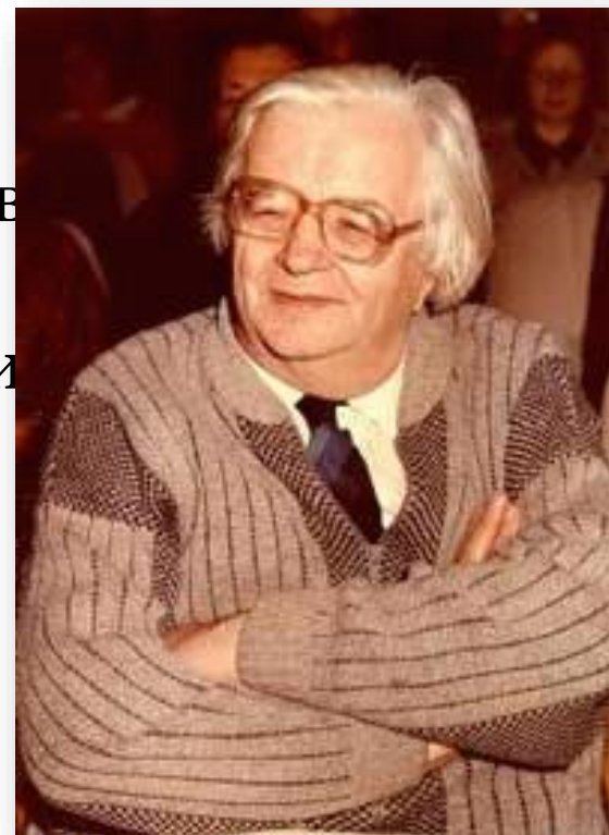
Валентин Дмитриевич Берестов

Родился Валентин Берестов в маленьком, тихом городке 1 апреля , в семье учителя истории. Отец будущего поэта и сам писал в юности стихи, и сыну сумел привить любовь к чтению. Поэтические способности у мальчика обнаружались очень рано. Он записывал стихи в тетрадь и хранил её в тайнике. Было это в 1942 году в Ташкенте, где в эвакуации жила семья Берестовых. В 1944 они переехала в Подмосковье. В Москве Валентин Дмитриевич поступил на исторический факультет МГУ, затем в аспирантуру института этнографии. В 1946 году его произведения начинают публиковаться в печати. А в 1957 выходят его первый поэтический сборник «Отплытие» и тоненькая книжка для дошкольников «Про машину».