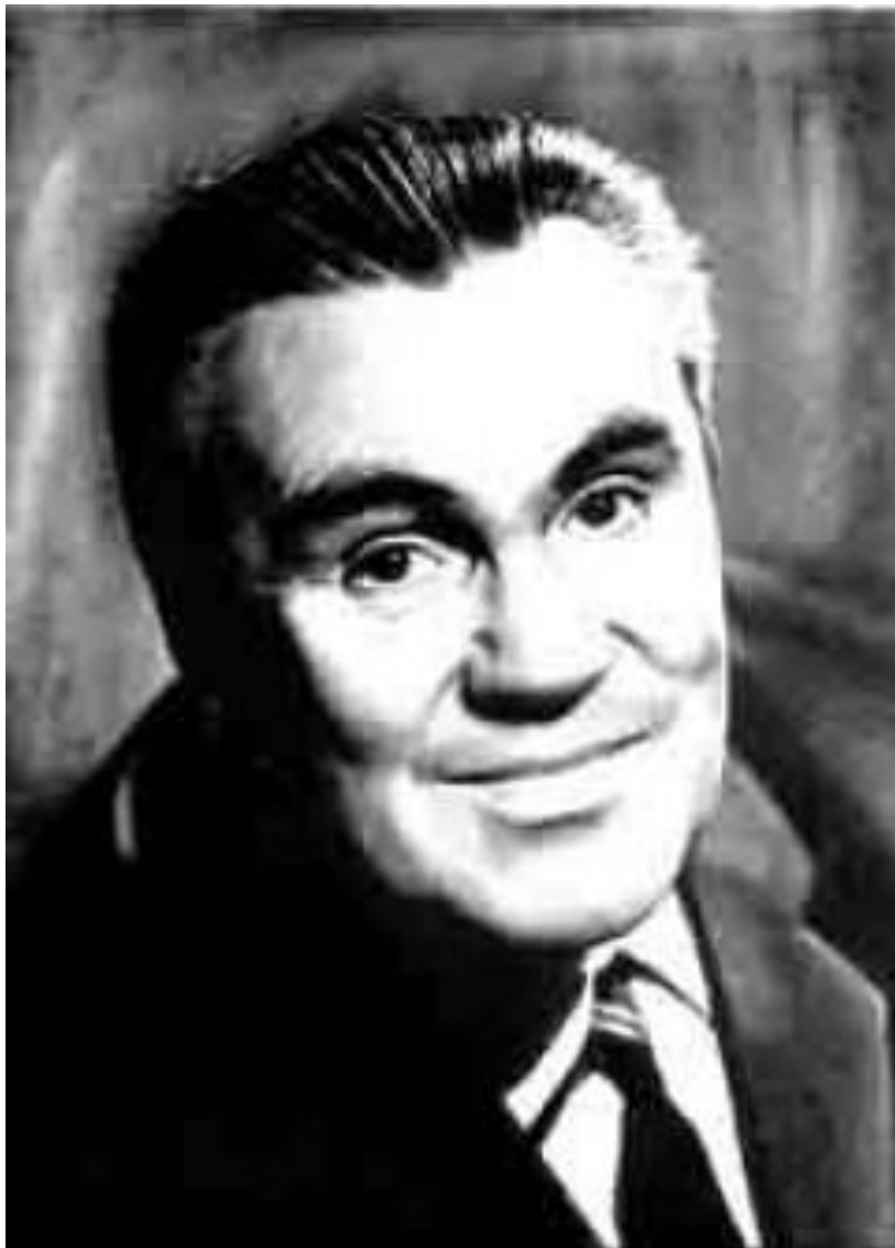
С. Васильев «Белая берёза»